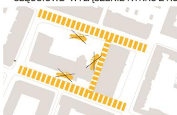
CZĘŚCIOWE WYŁĄCZENIE RYNKU Z RUCHU KOŁOWEGO

PODKREŚLENIE FUNKCJI RYNKU ●●●●○ MIEJSCA POSTOJOWE ●●●●○ OBSŁUGA KOMUNIKACYJNA BUDYNKÓW ●●●●○ MOŻLIWOŚĆ KSZTAŁTOWANIA PRZESTRZENI ●●●●○